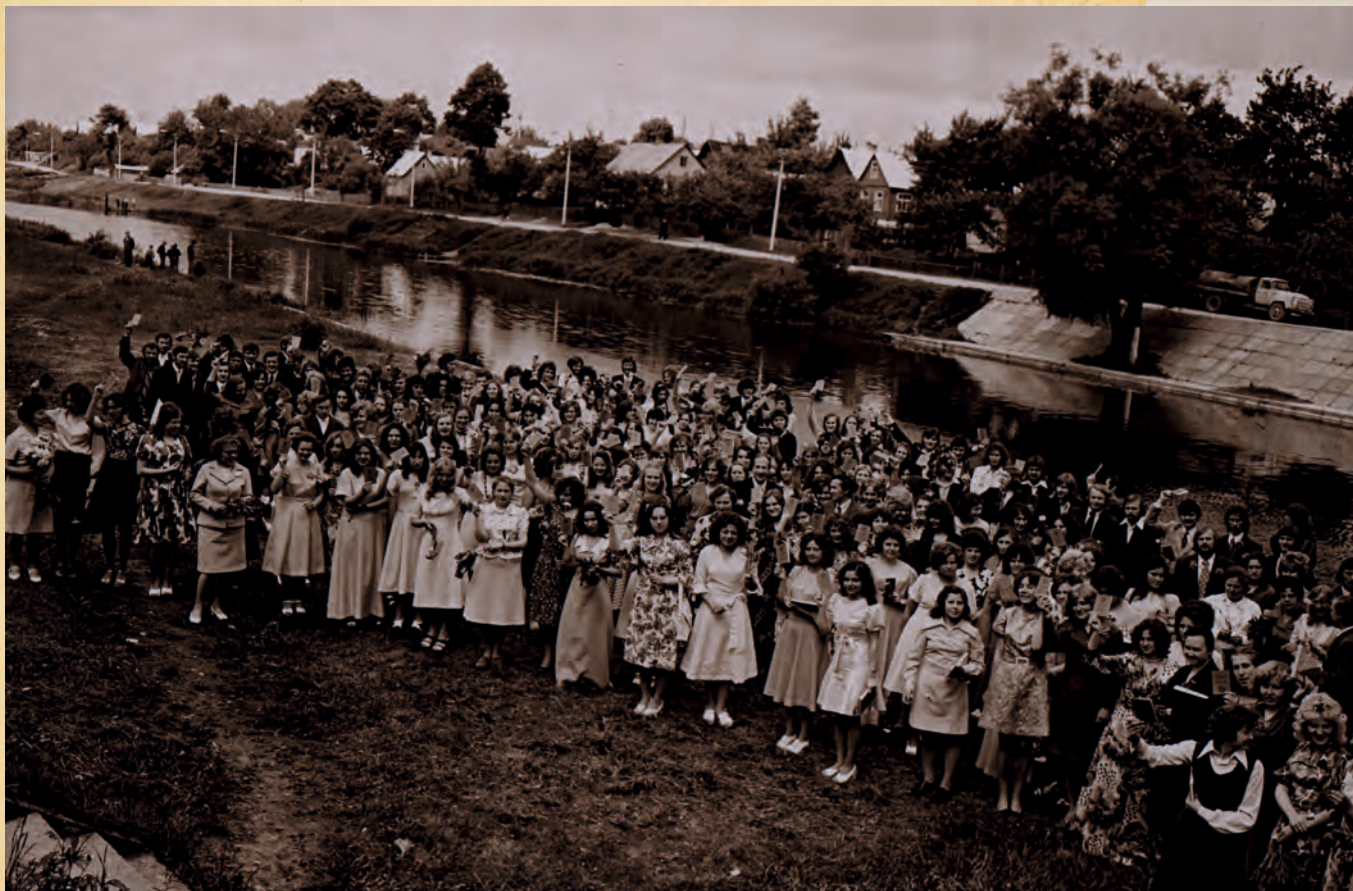
J. Švedo aukštesniosios pedagoginės mokyklos absolventai prie Nevėžio upės, XX a. 2 pusė. PKM27974F8629